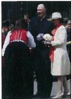
Kongeparet på festspillene i 2008.