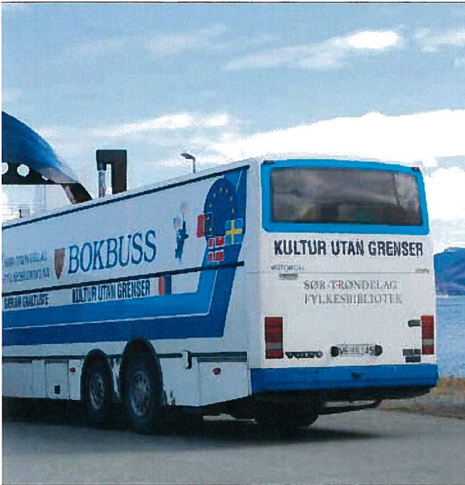
Linesøya ein gong i månaden.

– Åtteåringen har akkurat fått opp lesefarten, og har oppdaga «LasseMajas detektivbyrå», fortel ho.